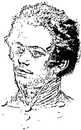
कार्ल मार्क्स छात्र के रूप में। चित्रकार-ए० ग्रिस्टेइन